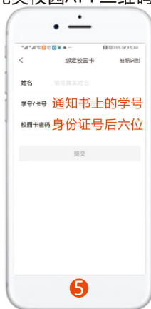
5 完成个人信息绑定 提交后认证成功