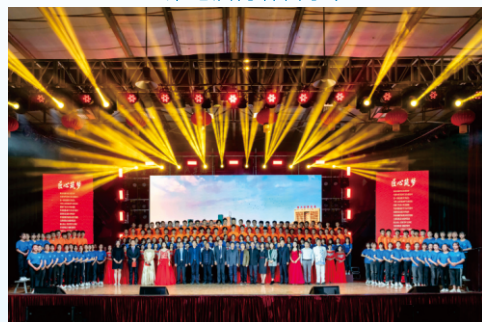
四十年办学成果展示文艺汇演