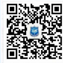
“武汉反电诈”微信公众号