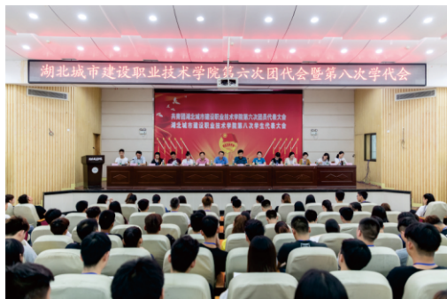
团员学生代表大会

协会名称：大学生记者团，大学生艺术团，青联志愿者协会，足球协会，摄影协会，氧气英语协会，wolf桌游社，心理协会，读书协会，魔术协会，羽毛球协会，乒乓球协会，炫风跆拳道协会，演讲与口才协会，散打协会，九天棋社，篮球社，清涟文学社，舞蹈协会，三希书画协会，结社之夏动漫社，open吉他社，双截棍协会，聚风轮滑社，子衿汉服社，定向越野协会，造艺公社，测量协会，手绘协会，造价协会，计算机协会，CAD协会，物流这会，园林协会，IF剧社。