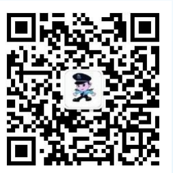
“武汉平安高校”微信公众号