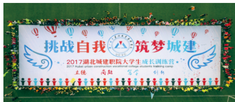
大学生成长训练营

协会名称：大学生记者团，大学生艺术团，青联志愿者协会，足球协会，摄影协会，氧气英语协会，wolf桌游社，心理协会，读书协会，魔术协会，羽毛球协会，乒乓球协会，炫风跆拳道协会，演讲与口才协会，散打协会，九天棋社，篮球社，清涟文学社，舞蹈协会，三希书画协会，结社之夏动漫社，open吉他社，双截棍协会，聚风轮滑社，子衿汉服社，定向越野协会，造艺公社，测量协会，手绘协会，造价协会，计算机协会，CAD协会，物流这会，园林协会，IF剧社。