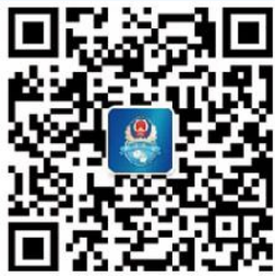
“武汉公安”微信公众号

新生朋友，为了你们能顺利安全的度过大学学习生活，警察蜀黍在这里提前操心了。下面有你们从入学到毕业都可能用到的知识，拿走不谢！平安就读，武汉公安呵护到底！