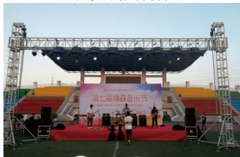
第七届博森音乐节