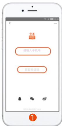
1 输入手机号 并获取验证码