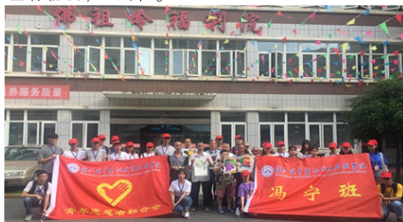
学院冯宁志愿者服务队